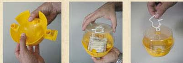
Manejo fácil y sencillo. Evitar golpes a la trampa una vez montada.

Tapa Killtap, también para Maxitrap. Envase individual.