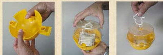
Manipulació fàcil i senzilla. Evitar donar cops a la trampa un cop muntada.

Sigfito Agroenvases és una entitat sense ànim de lucre que soluciona la recollida d'envasos fitosanitaris marcats amb el logo de SIGFITO.